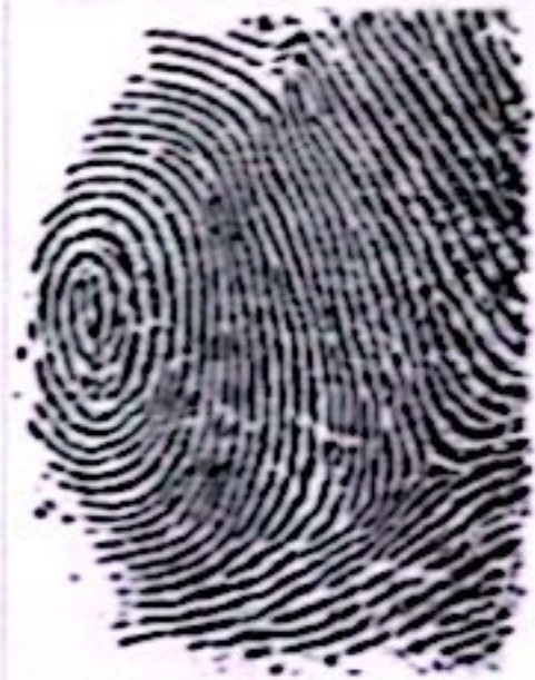
Ngón trỏ trái Left index finger